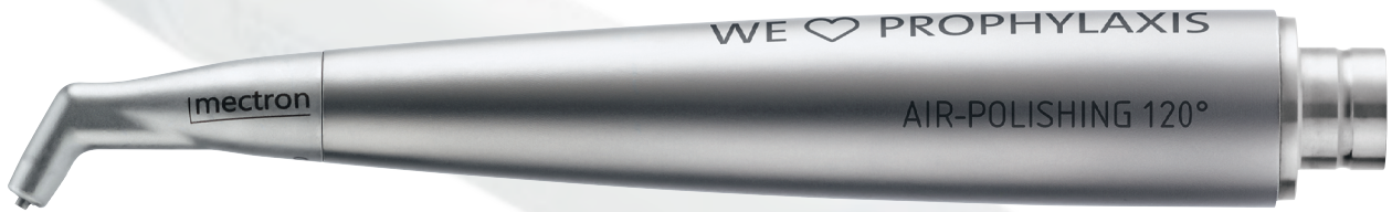
→ PULVERSTRAHL-HANDSTÜCK 120°