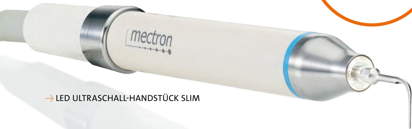
→ LED ULTRASCHALL-HANDSTÜCK SLIM