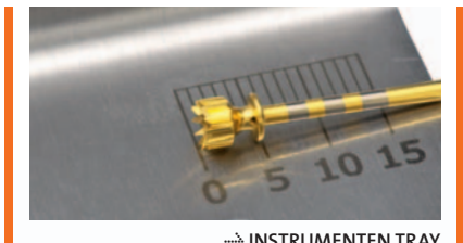
→ INSTRUMENTEN TRAY