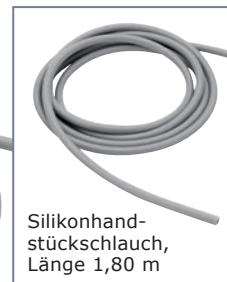
Silikonhandstückschlauch, Länge 1,80 m